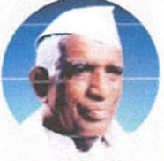
Founder President, Council of Education, Kolhapur