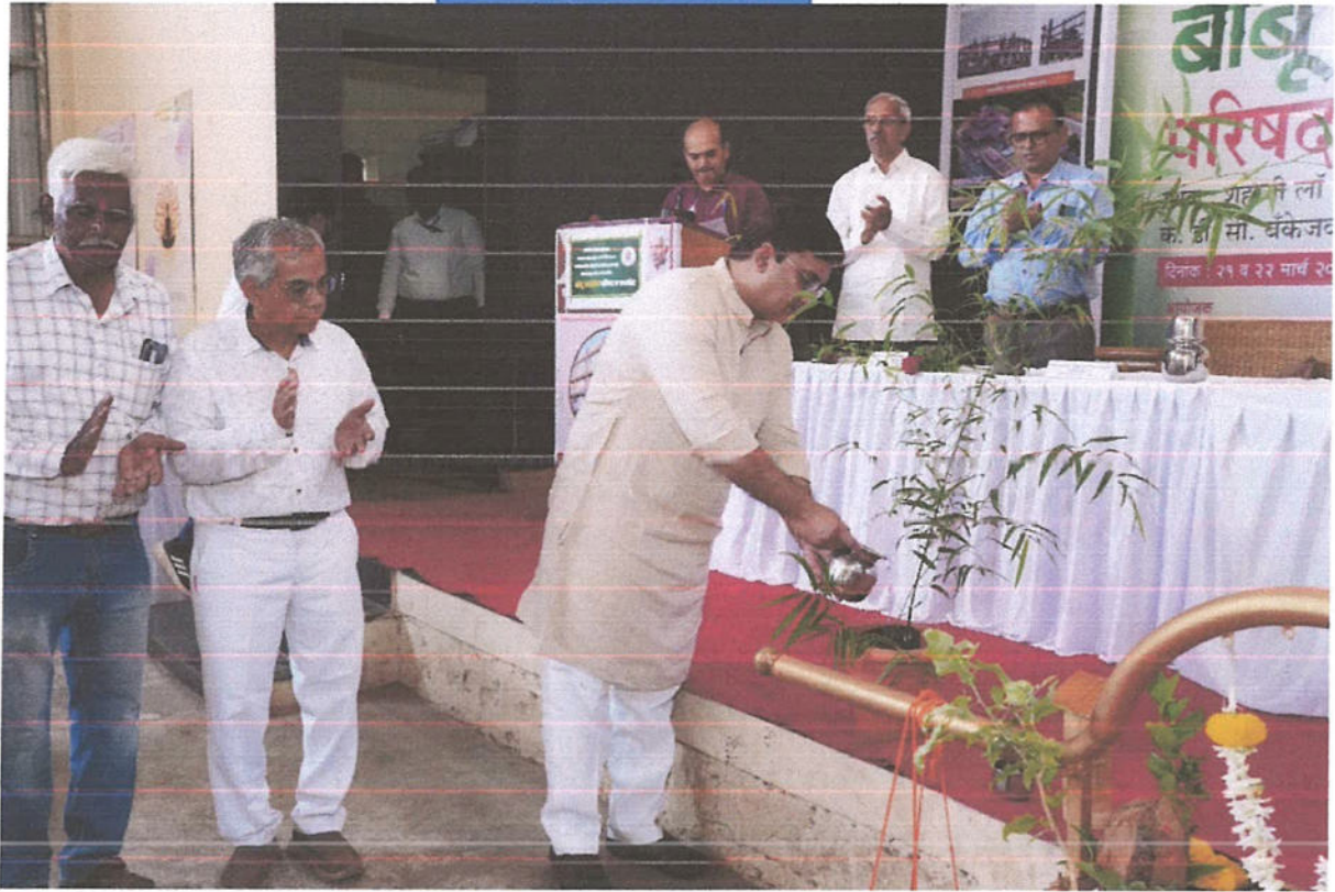
Inaugurated by Hon'ble Dhananjay Mahadik, Hon'ble Dr. Vishwanath Magdum